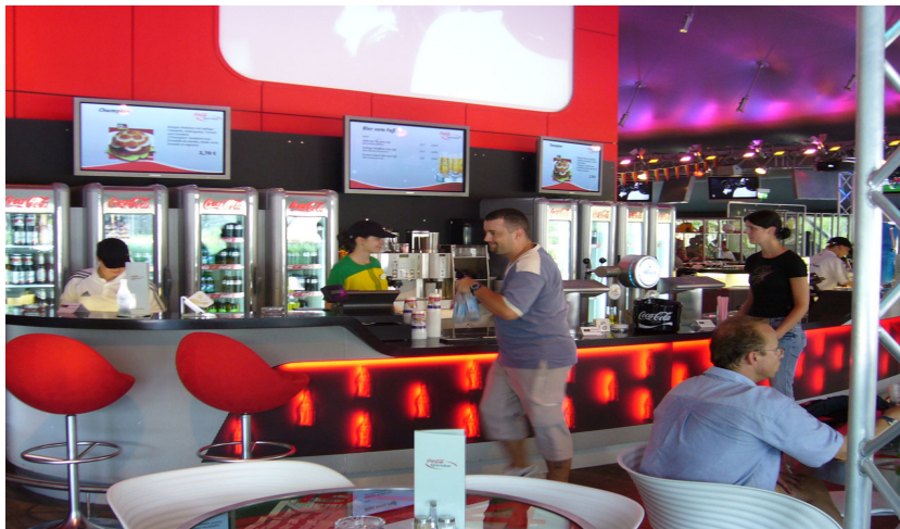
Beispiel: Realisiertes Infotainment im Europa-Park, Rust.